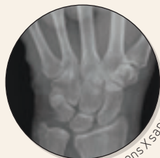
Rayons X sans orthèse