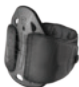
EXOS FORM™ II Page 7