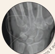
Rayons X avec orthèse