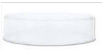
Anneau d'extension de four Exos®